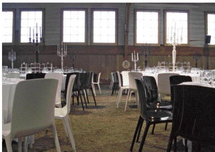
Design-Möbel schaffen Ambiente.

«Jedes Modell ist ein Highlight, wenn es für den Kunden und für