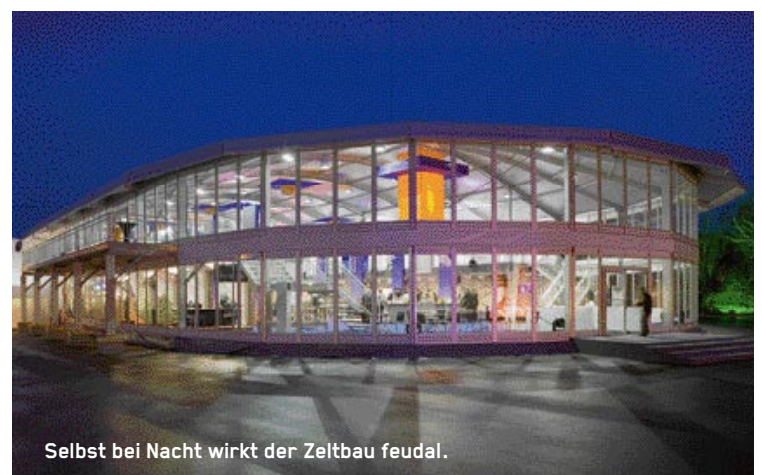
Selbst bei Nacht wirkt der Zeltbau feudal.

800 Zelte werden es sein, zum Beispiel in Peking vor dem Hauptstadion, dem Birdsnest, neben dem Wa-