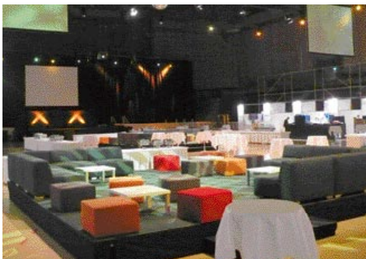
Mit einfachen Sitzmöbeln Ambiente schaffen.