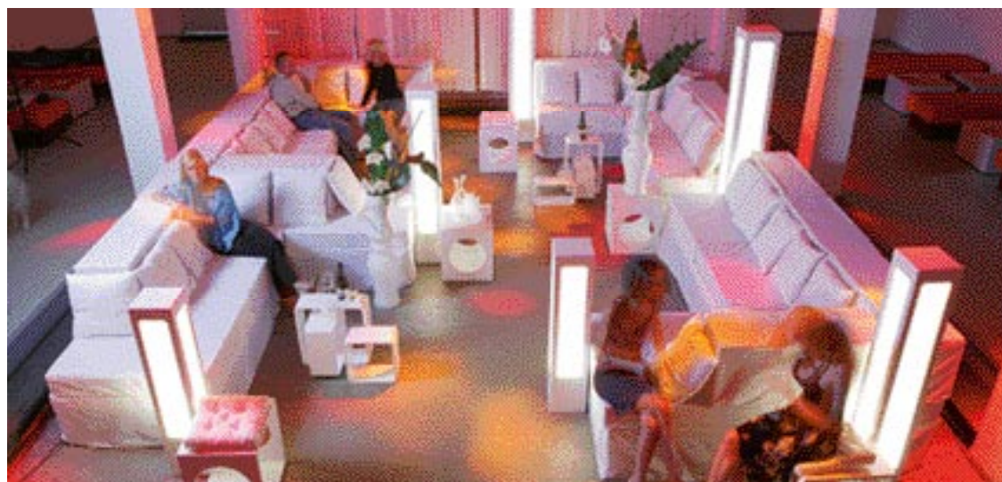
Die Lounge mit Atmosphäre.