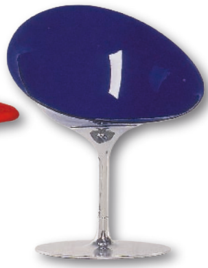
Kopfstand: Möbelkultur auf Messen und Events.