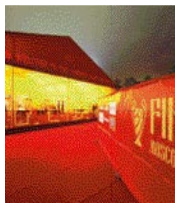
Uefa Champions League in Moskau mit Orgatent