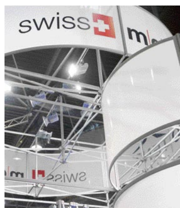
Erweiterung des bewährten Swiss-Modul-4000 mit runden Elementen

Röder Zeltsysteme und Service AG, Bidingen, www.r-zs.de ■