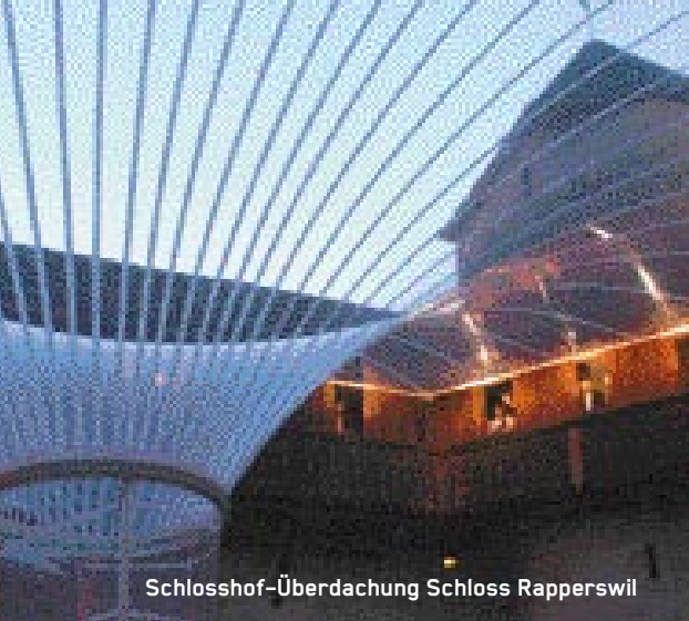
Schlosshof-Überdachung Schloss Rapperswil