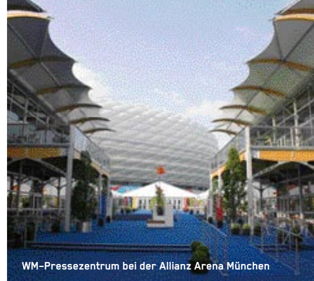
WM-Pressezentrum bei der Allianz Arena München