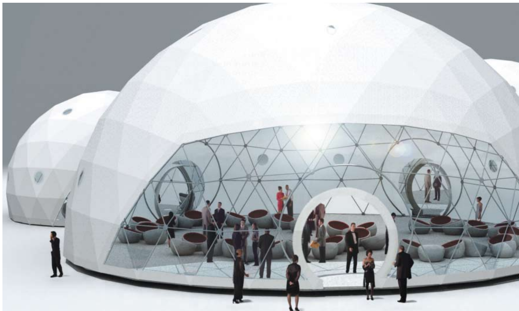
Der Zendome: das futuristische Zeltkonzept für eine offene, kommunikative Atmosphäre.

Eventplattformen gewinnen immer stärker an Bedeutung. Live-Kommunikation kreiert nicht nur ein einzigartiges Erlebnis, sie erzielt auch bei Zielpublikum und Gästen eine positive und nachhaltige Marketingwirkung. Die Blasto AG aus Jona, ein führender Schweizer Anbieter von Mietzelten und Mietmobiliar, sorgt seit über 25 Jahren für perfekte Ambiance – beim kleinen Geschäftsanlass so gut wie beim spektakulären Grossereignis.